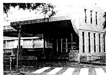
L'ingresso del liceo classico Muratori, in via Cittadella

Nella classe riservata agli studenti disabili vennero svuotate taniche di benzina e il rogo distrusse in poco tempo dieci aule.